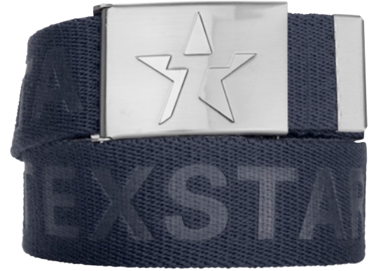
MIDJE- BÄLTE AB02 Unisex