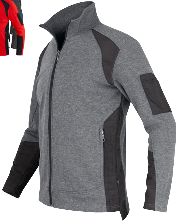
CREW CARDIGAN SW09 Men | SWW9 Women