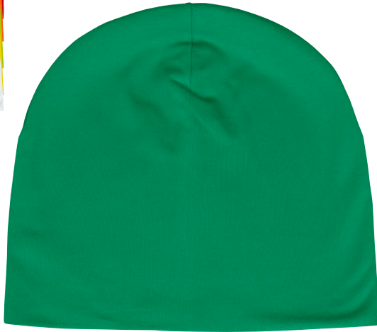
MÖSSA BEANIE AC12 Unisex