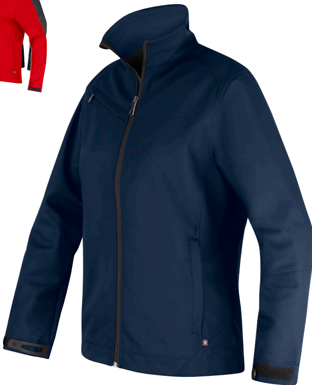
SOFTSHELL JACKET FJ79 Men | WJ79 Women