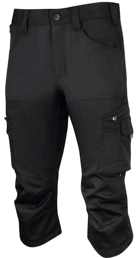
DUTY STRETCH PIRATE SHORTS FS18 Unisex