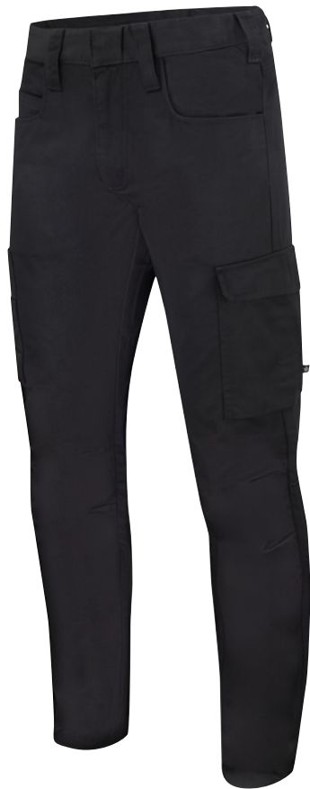
SERVICE PANTS FP46 Men | WP46 Women