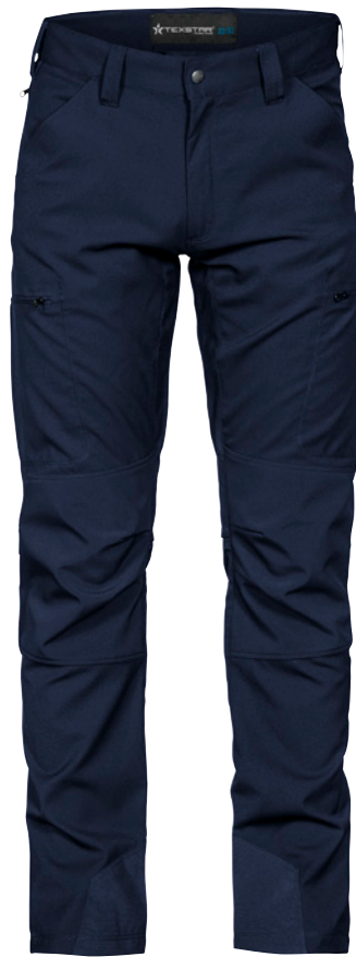
STRETCH PANTS FP33 Unisex