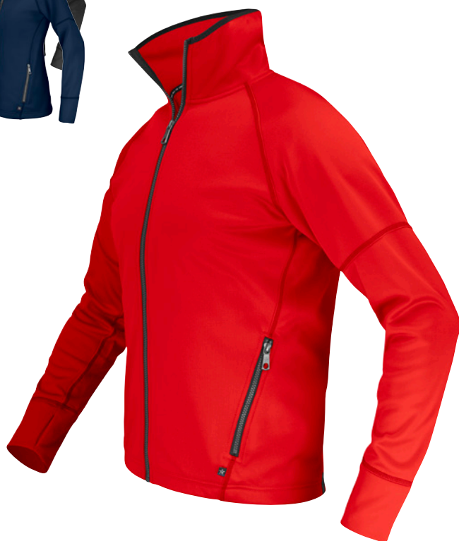
TEAM JACKET FJ68 Men | WJ68 Women