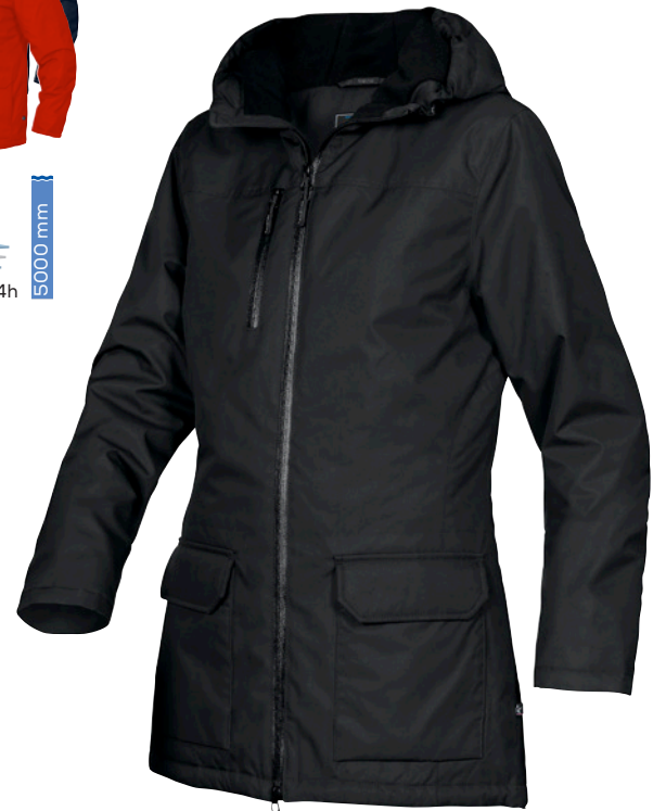
WINTER JACKET LONG FJ65 Men | WJ65 Women