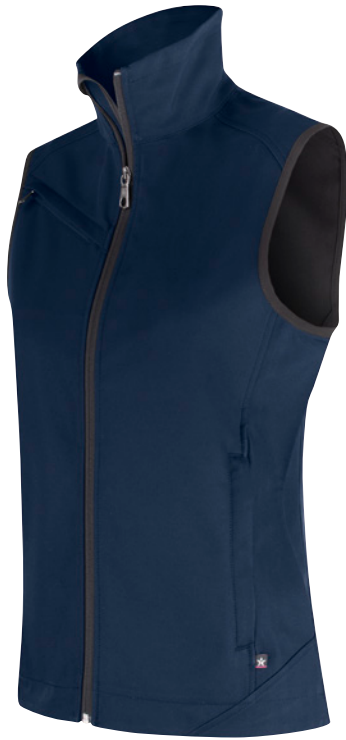
SOFTSHELL VEST FV79 Men | WV79 Women