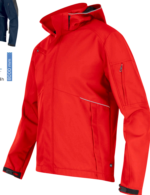
SOFTSHELL JACKET 3-L FJ80 Men | WJ80 Women