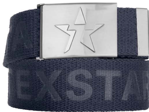
MIDJE-BÄLTE AB02 Unisex