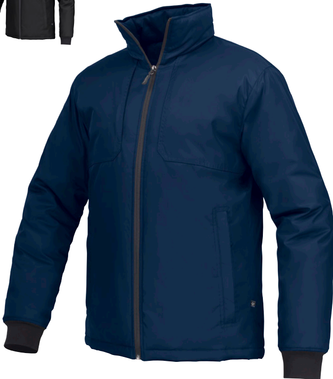
WINTER JACKET BASE FJ76 Unisex