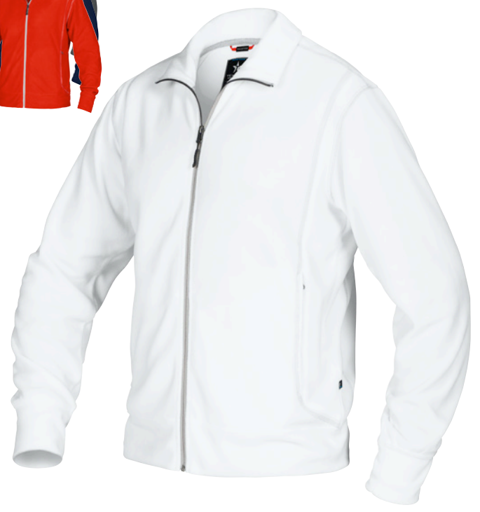
LIGHT FLEECE FJ36 Men | WJ36 Women