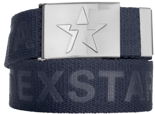
MIDJE-BÄLTE AB02 Unisex