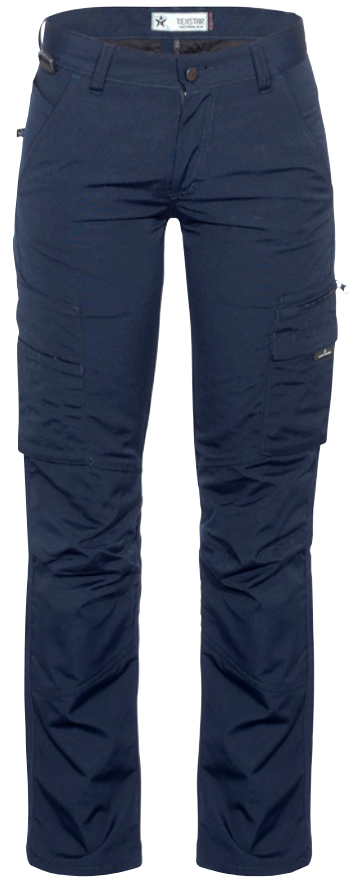
DUTY POCKET PANTS FP20 Men | WP20 Women